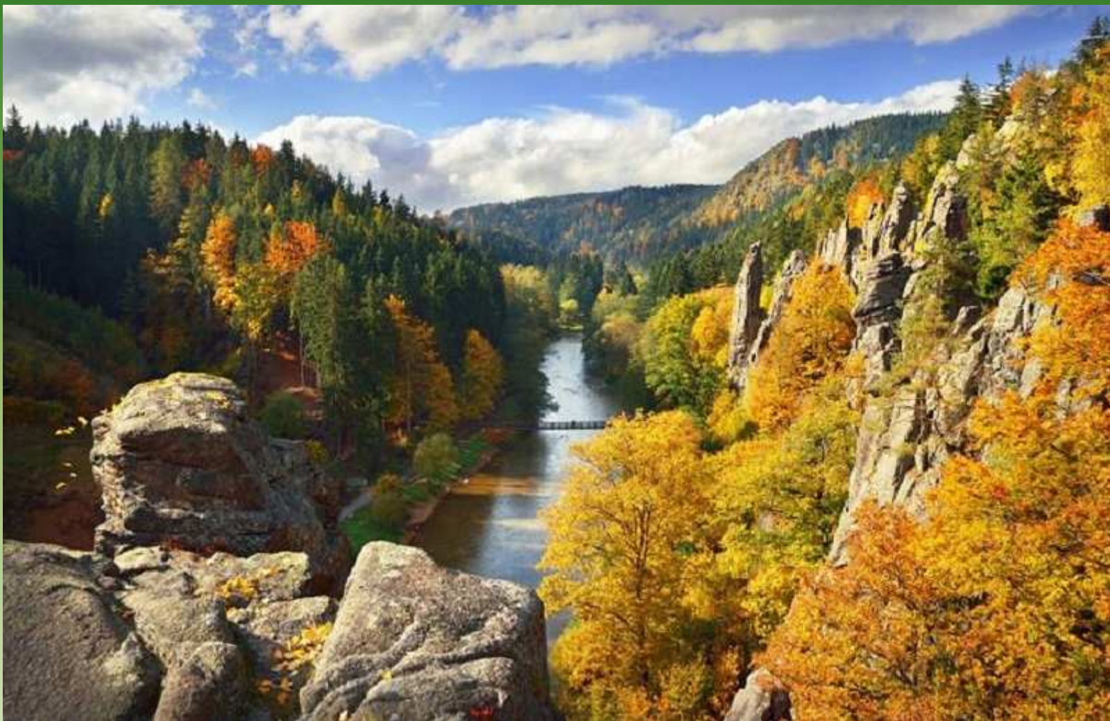
Svatošské skály u Karlových Varů