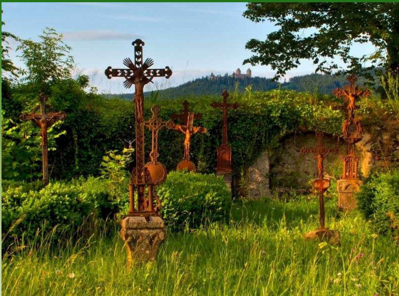
Starý hřbitov, v pozadí Kašperk