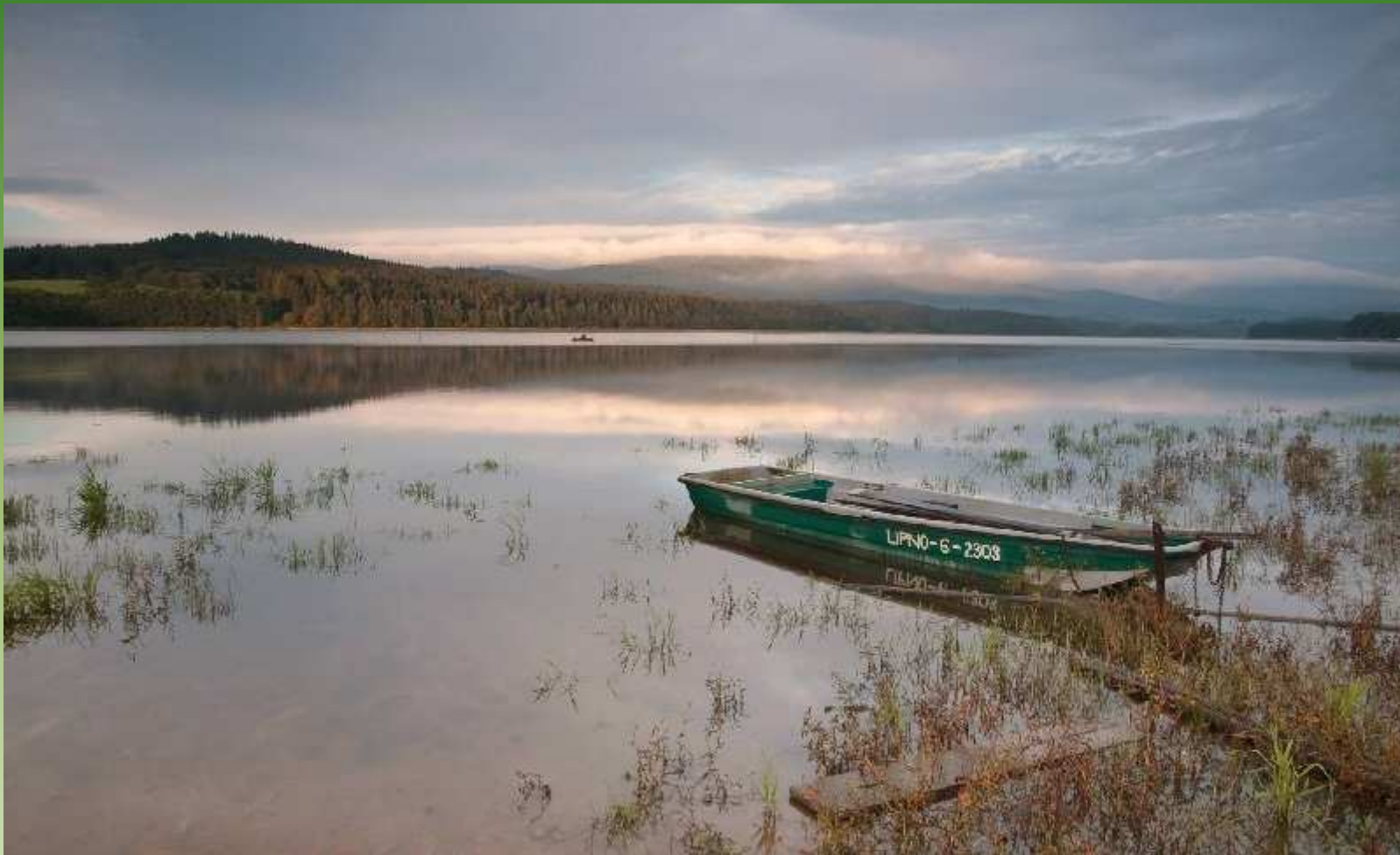
Krásné ráno na Lipně