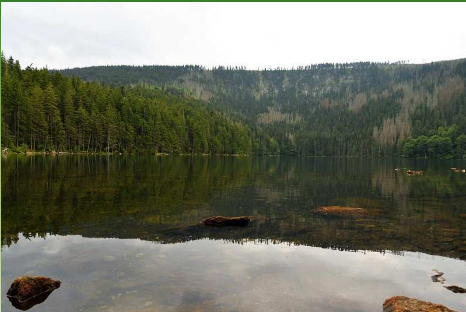
Černé jezero - Šumava