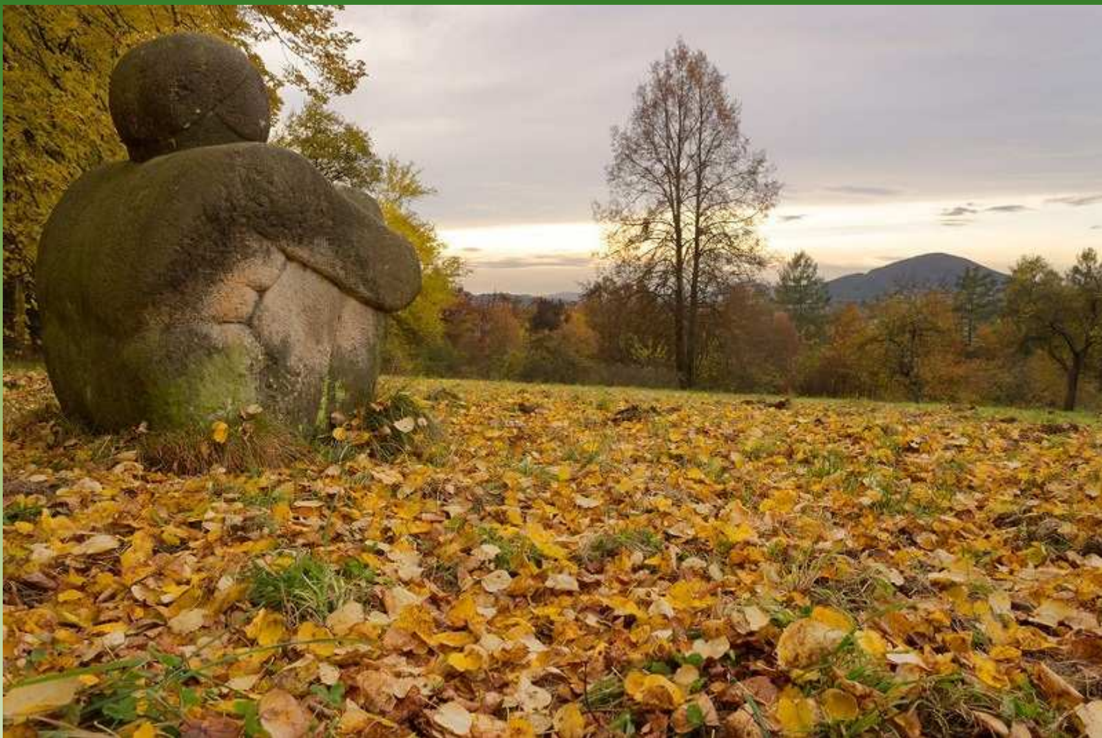
Kamenná socha - Lembersko, severní Čechy