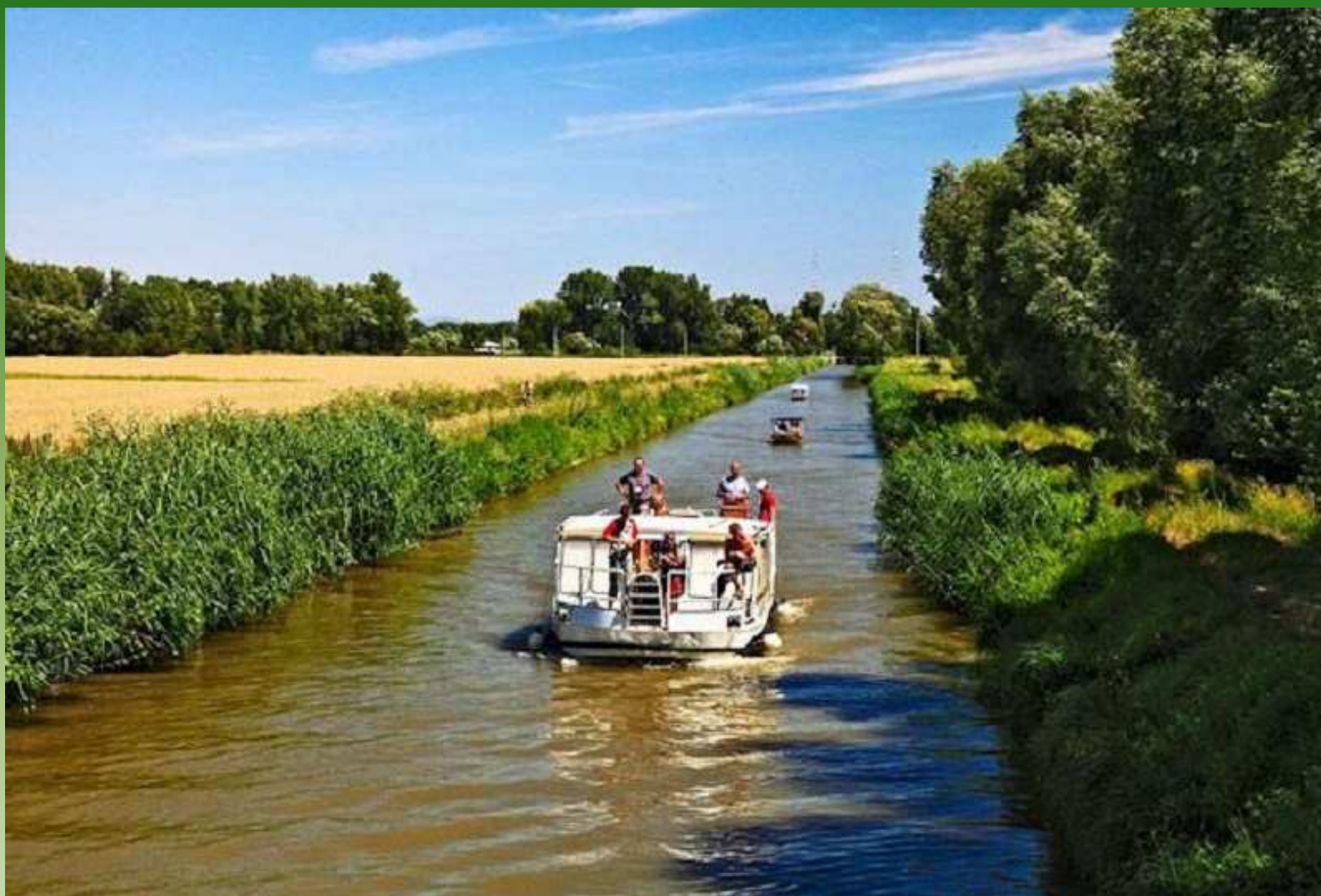
Bařův kanál - 53km dlouhá turistická vodní cesta