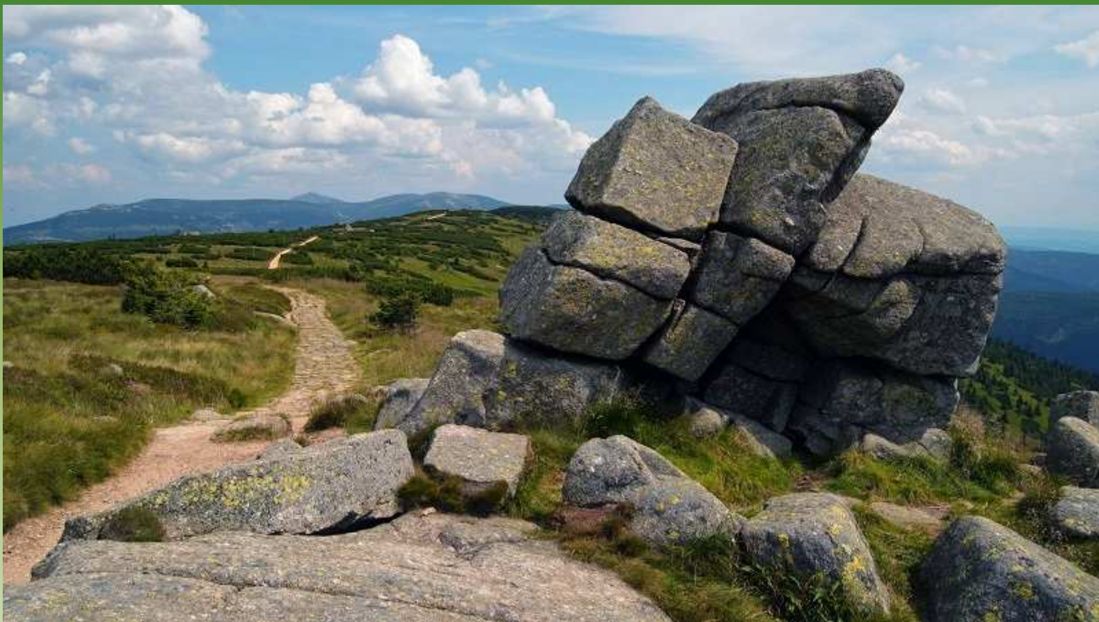
Krkonošská hora Harrachovy kameny