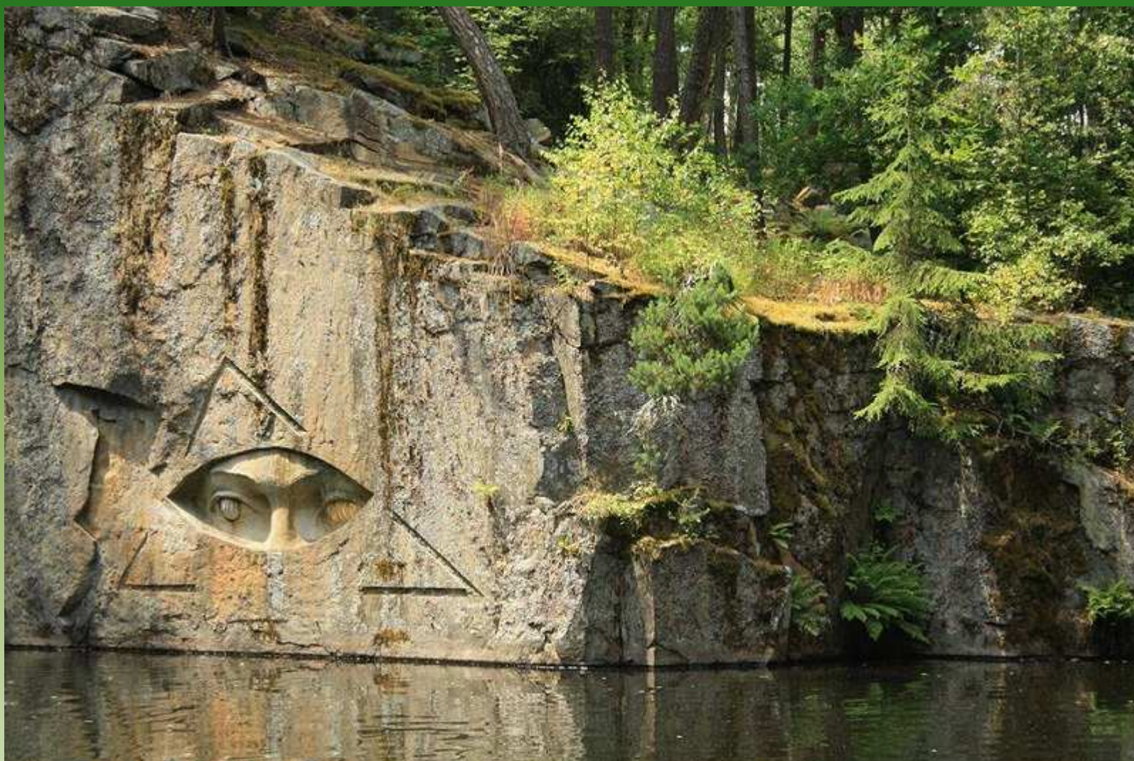
Zlaté oči - Národní památník odposlechu u Lipnice nad Sázavou