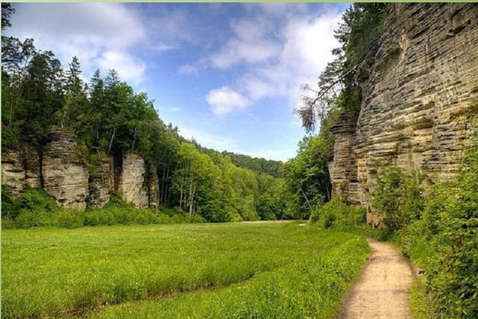
Údolí Plakánek poblíž hradu Kost