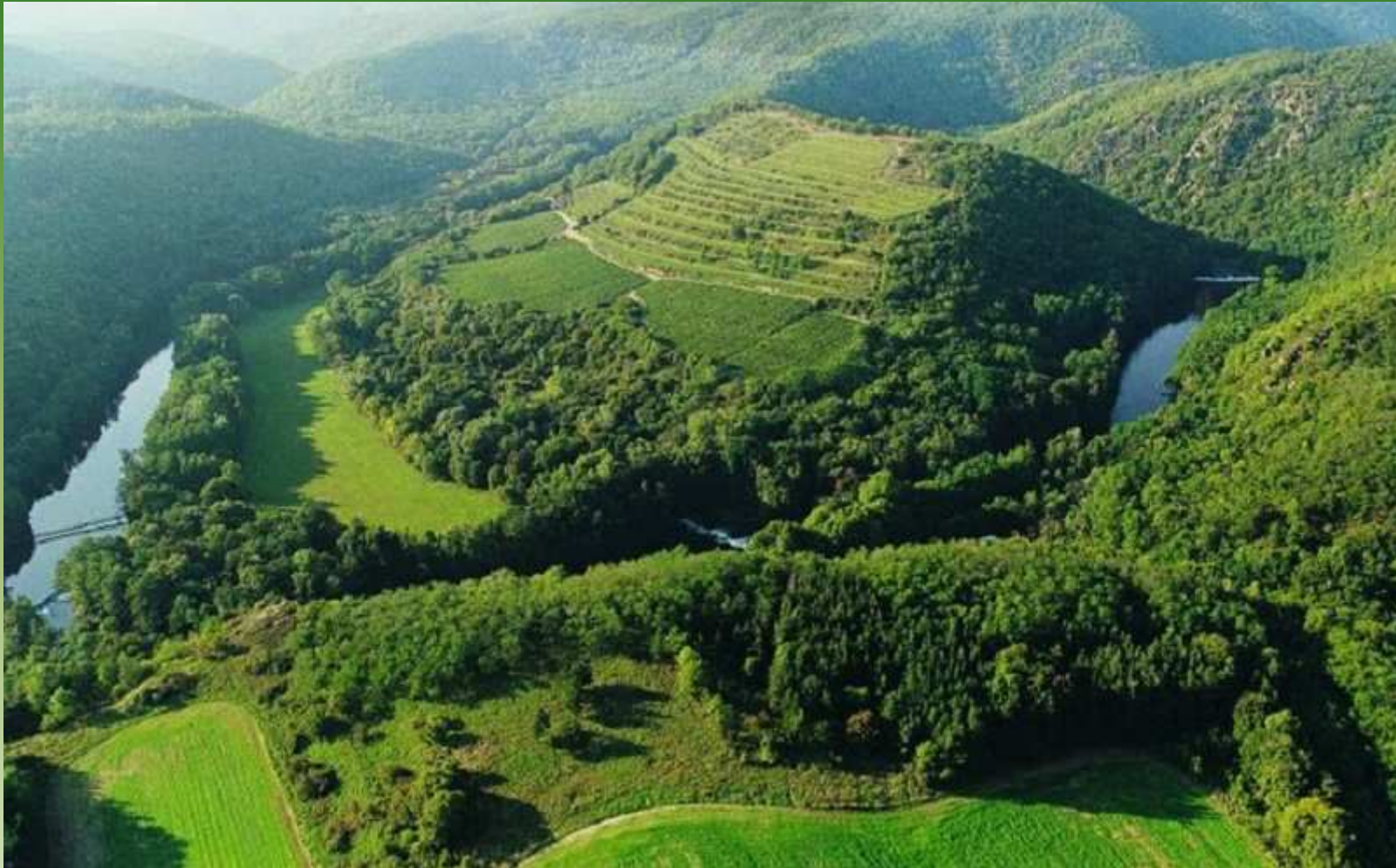
Vinice Šobes - Podyjí