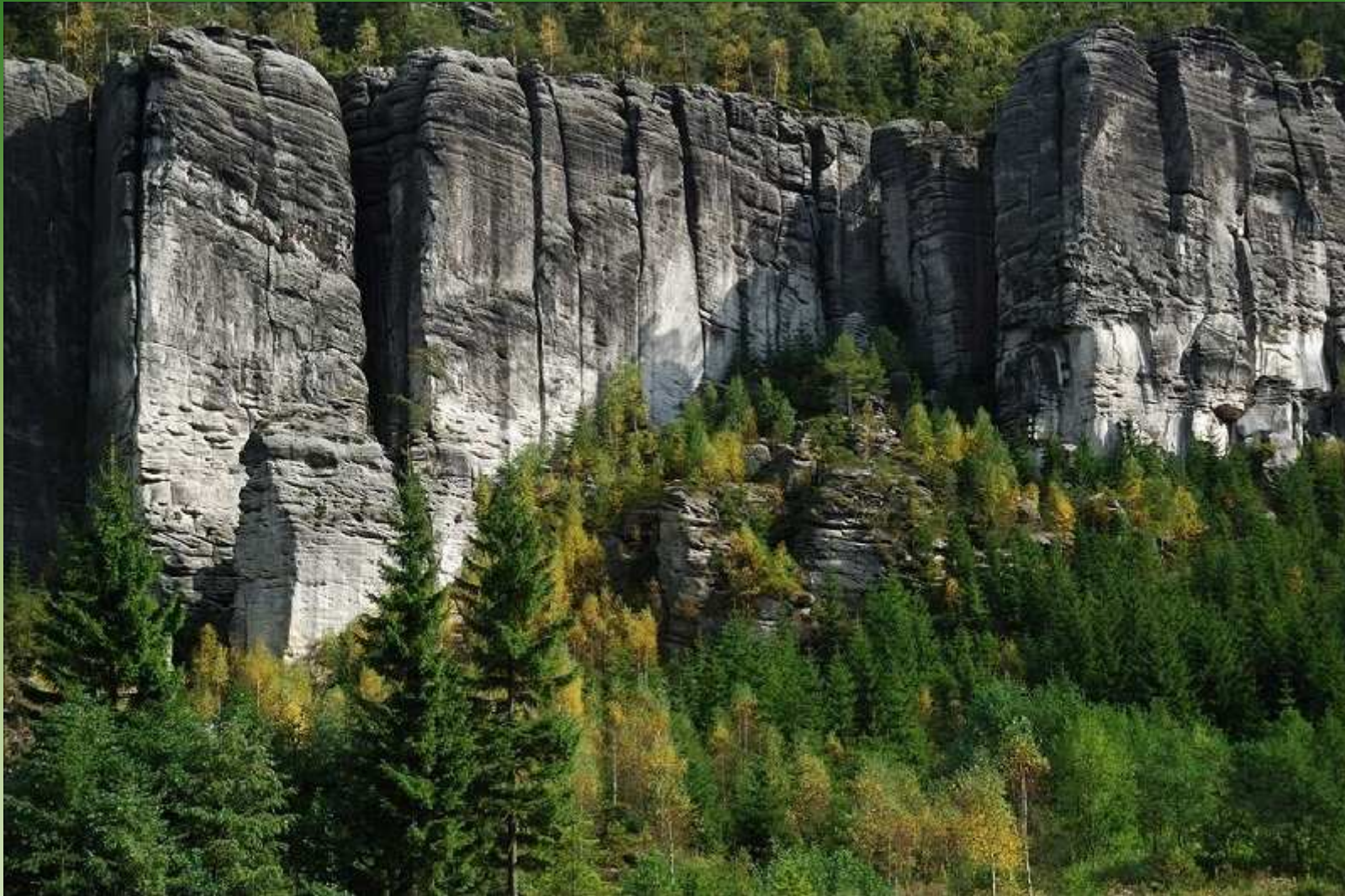
Chrámové stěny - Adršpach