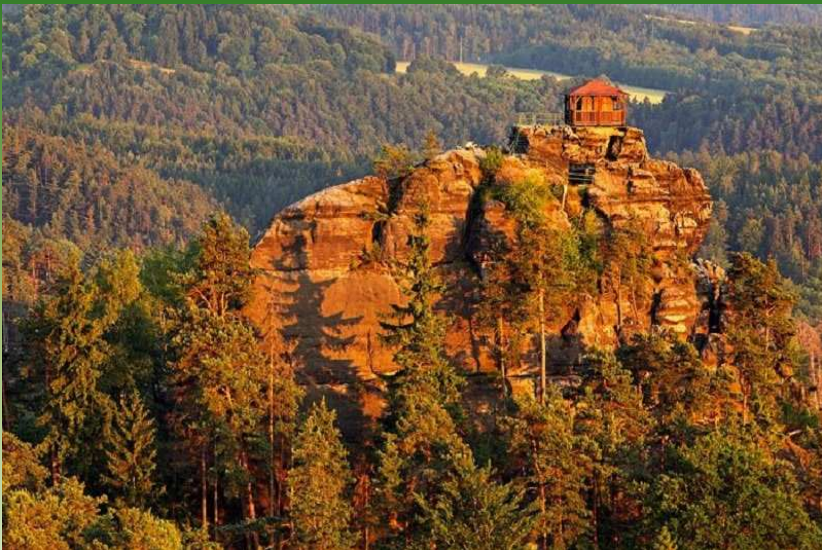
Mariina vyhlídka - České Švýcarsko