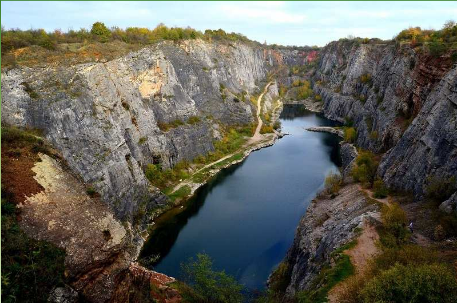
Lom Velká Amerika - Berounsko