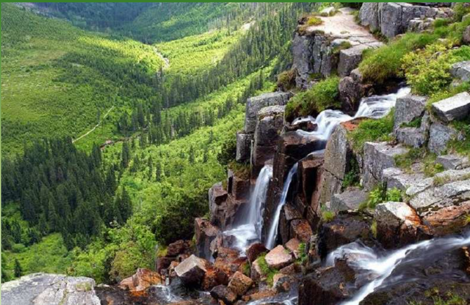
Krkonoše - Pančavský vodopád