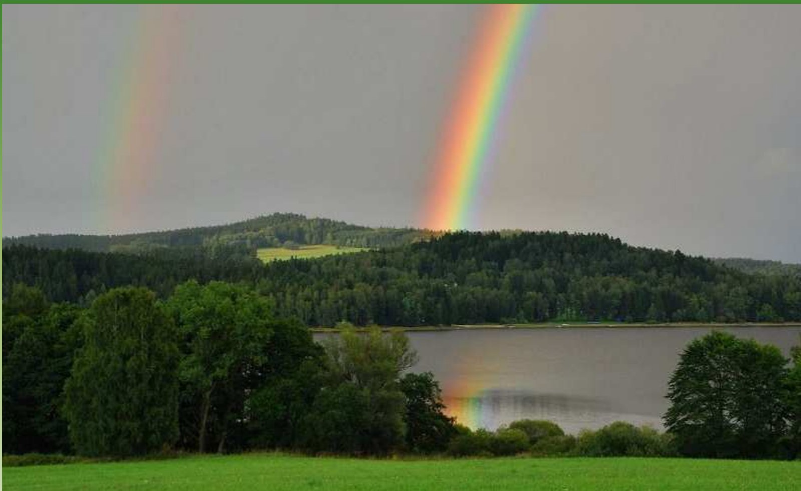
Duha na Šumavě