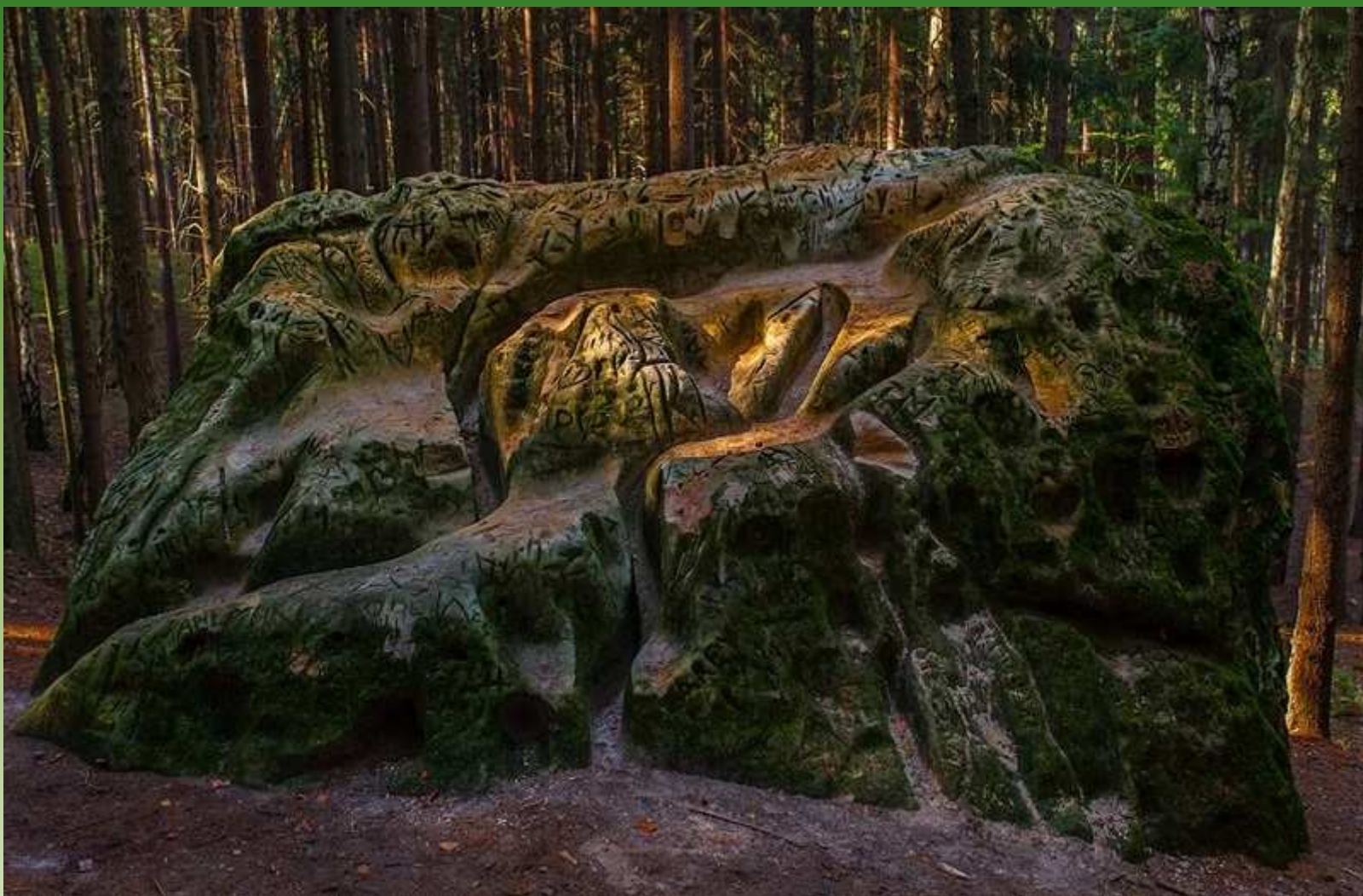
Čertův kámen na Lounsku