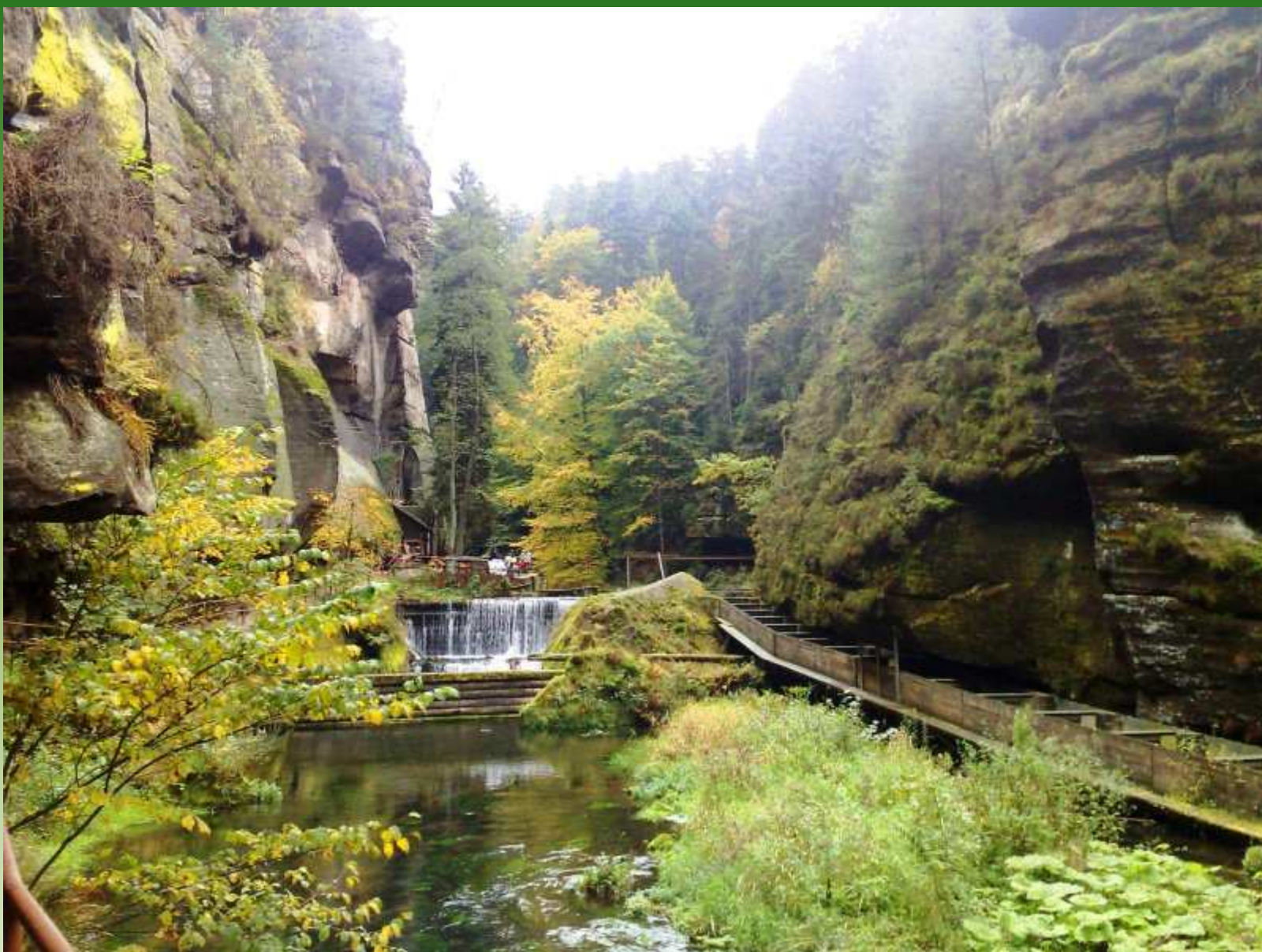
Hřensko - soutěska