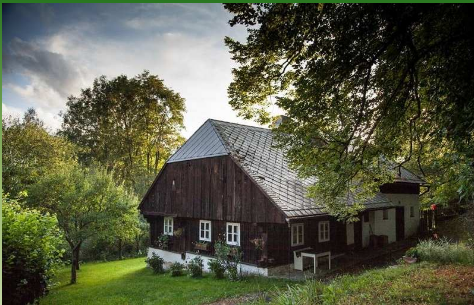
Zelená Lhota - Nýrsko - chaloupka ve stínu památných stromů