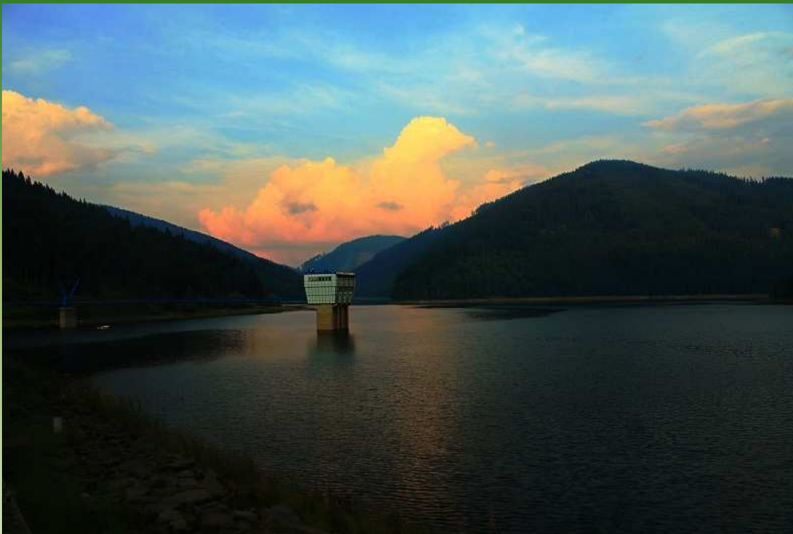
Vodní nádrž Šance na horním toku řeky Ostravice - Moravskoslezské Beskydy