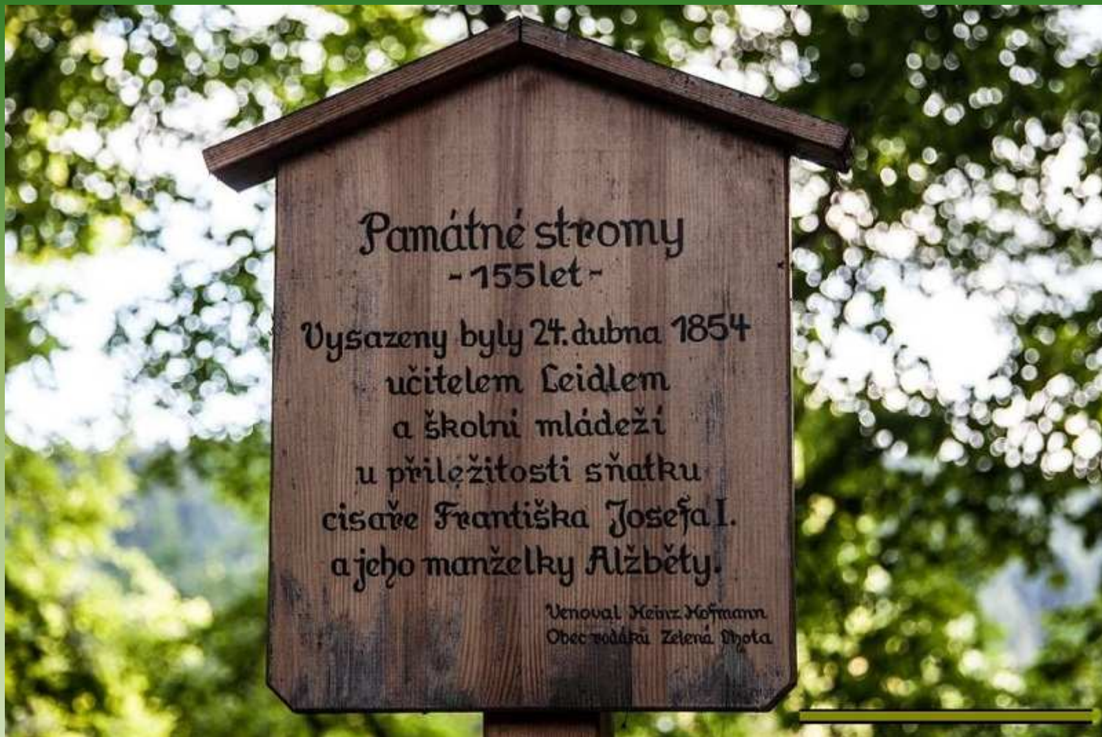
Zelená Lhota - Nýrsko - památné stromy