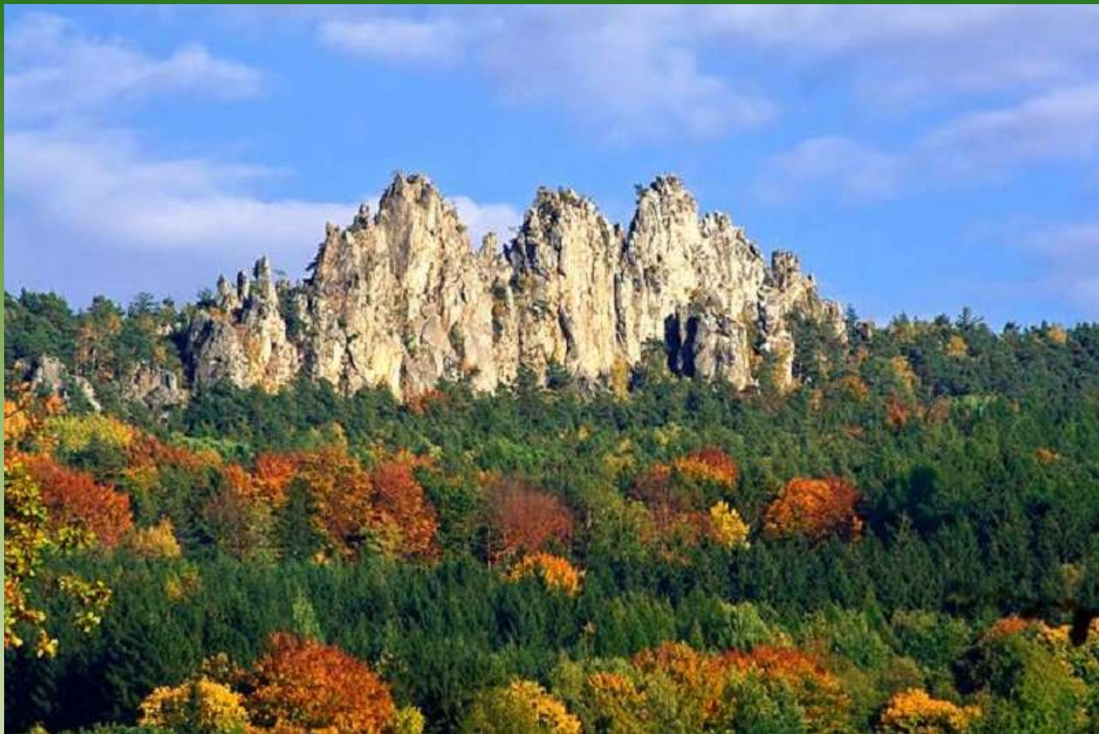
Suché skály - Český ráj