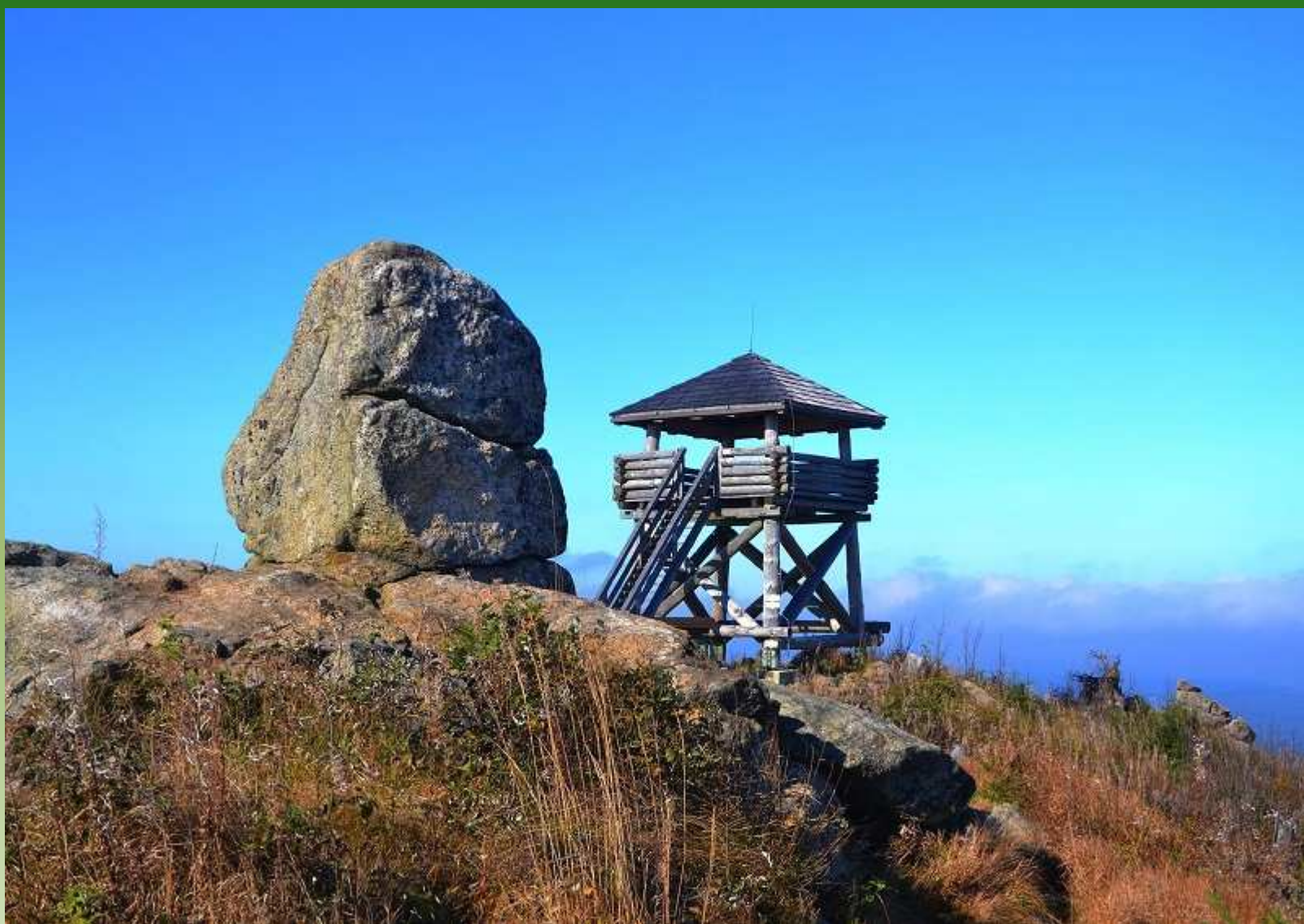
Šumava - Knížecí stolec