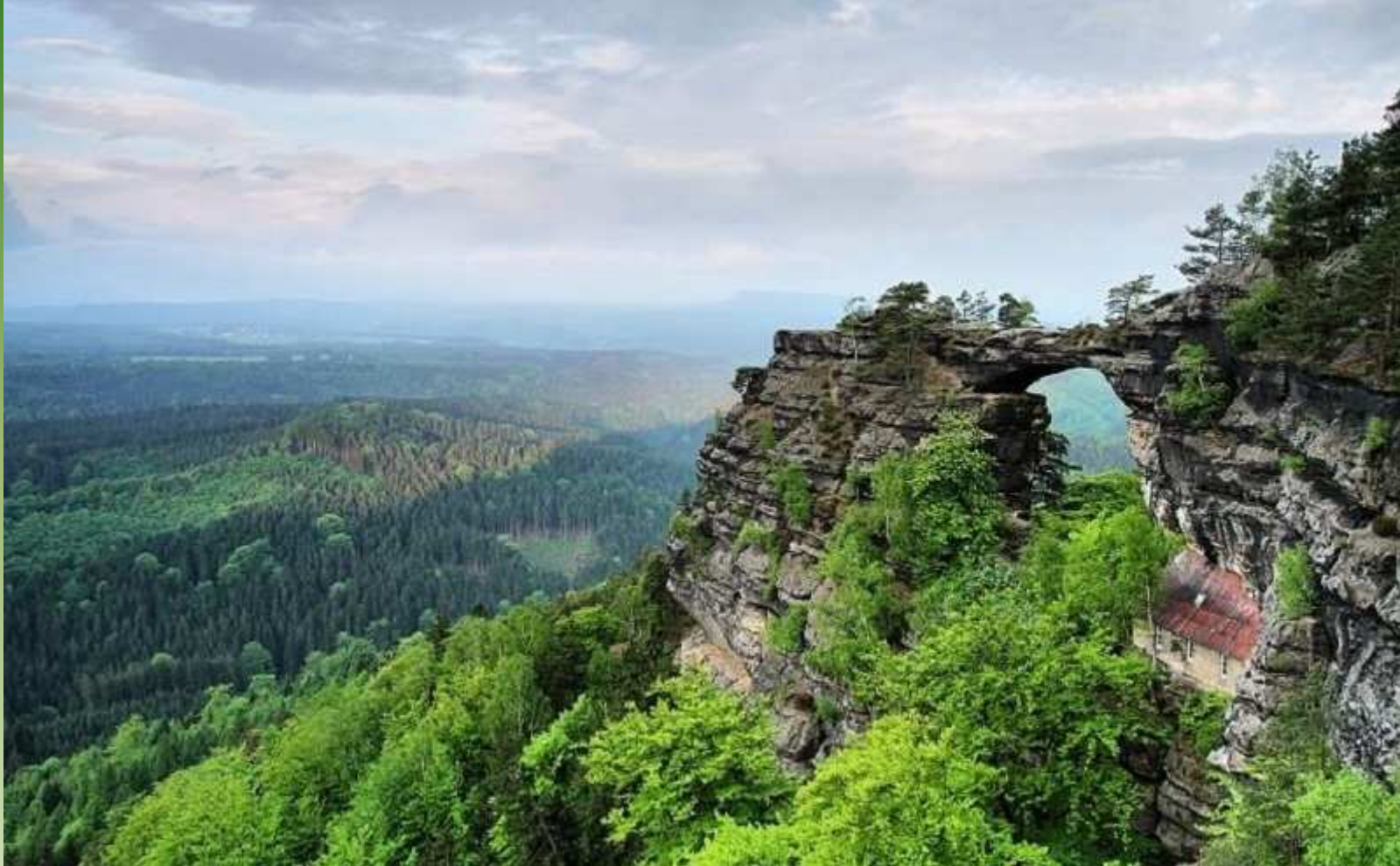
Pravčická brána - Hřensko