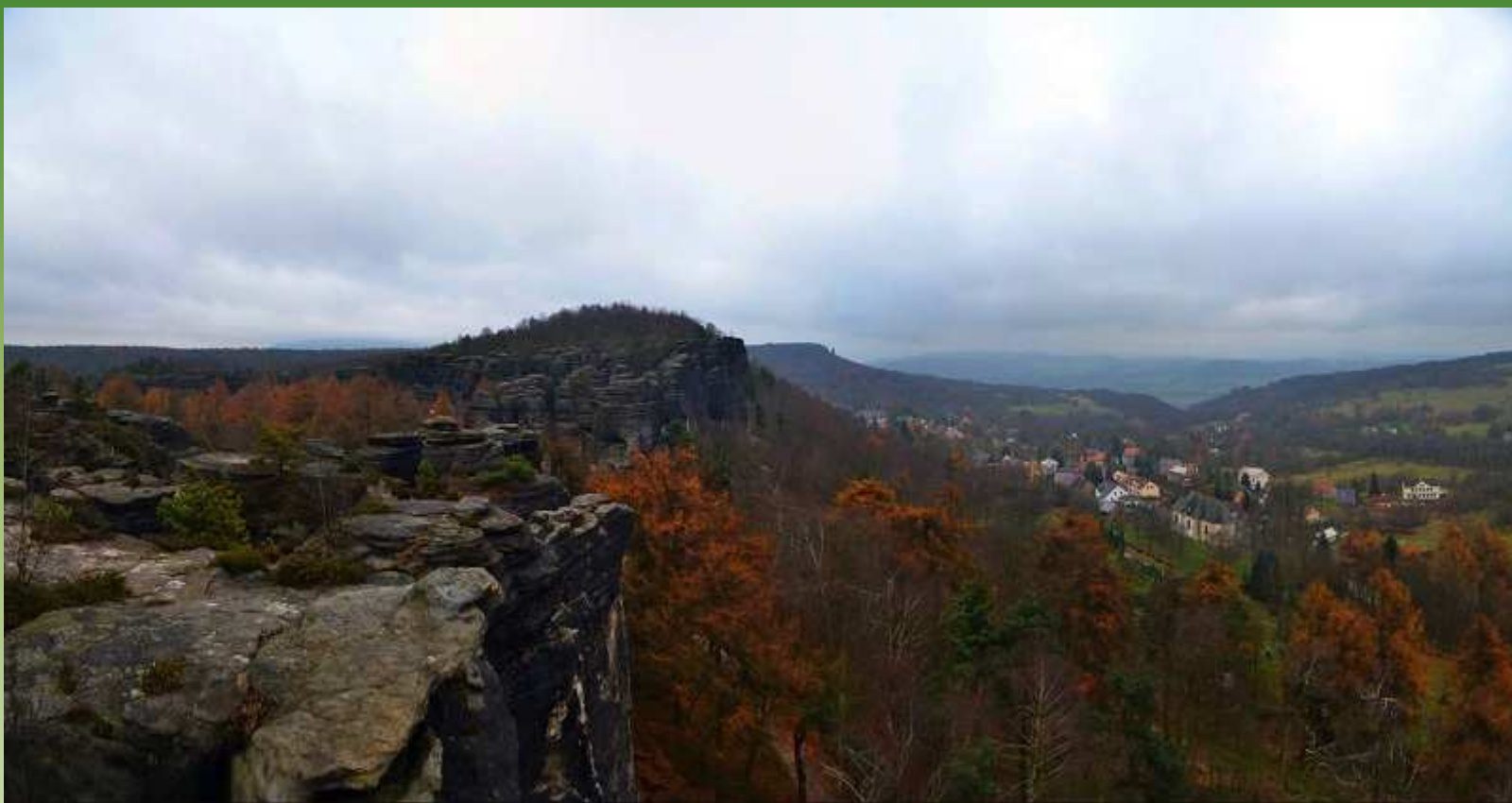
Tiské stěny - Děčínsko