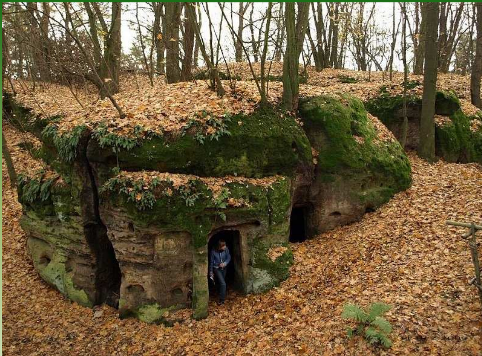
Valečovské světničky-skální byty: u hradu Valečov v Českém ráji se dochovalo 28 místností vytesaných do pískovcových skal. Sloužily jako obydlí hradní čeledi, lidé tu bydleli až do r.1892