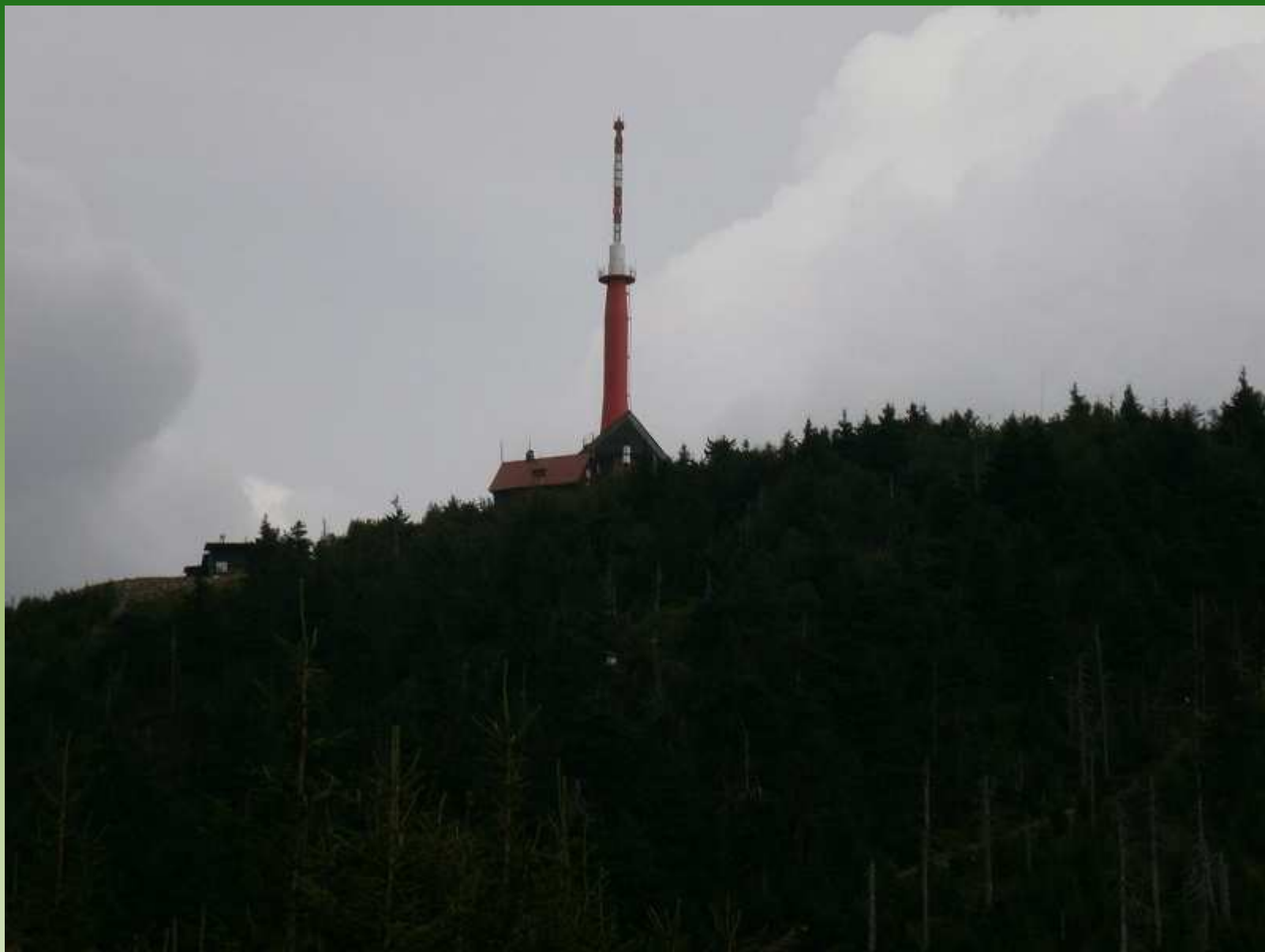
Lysá hora - Beskydy