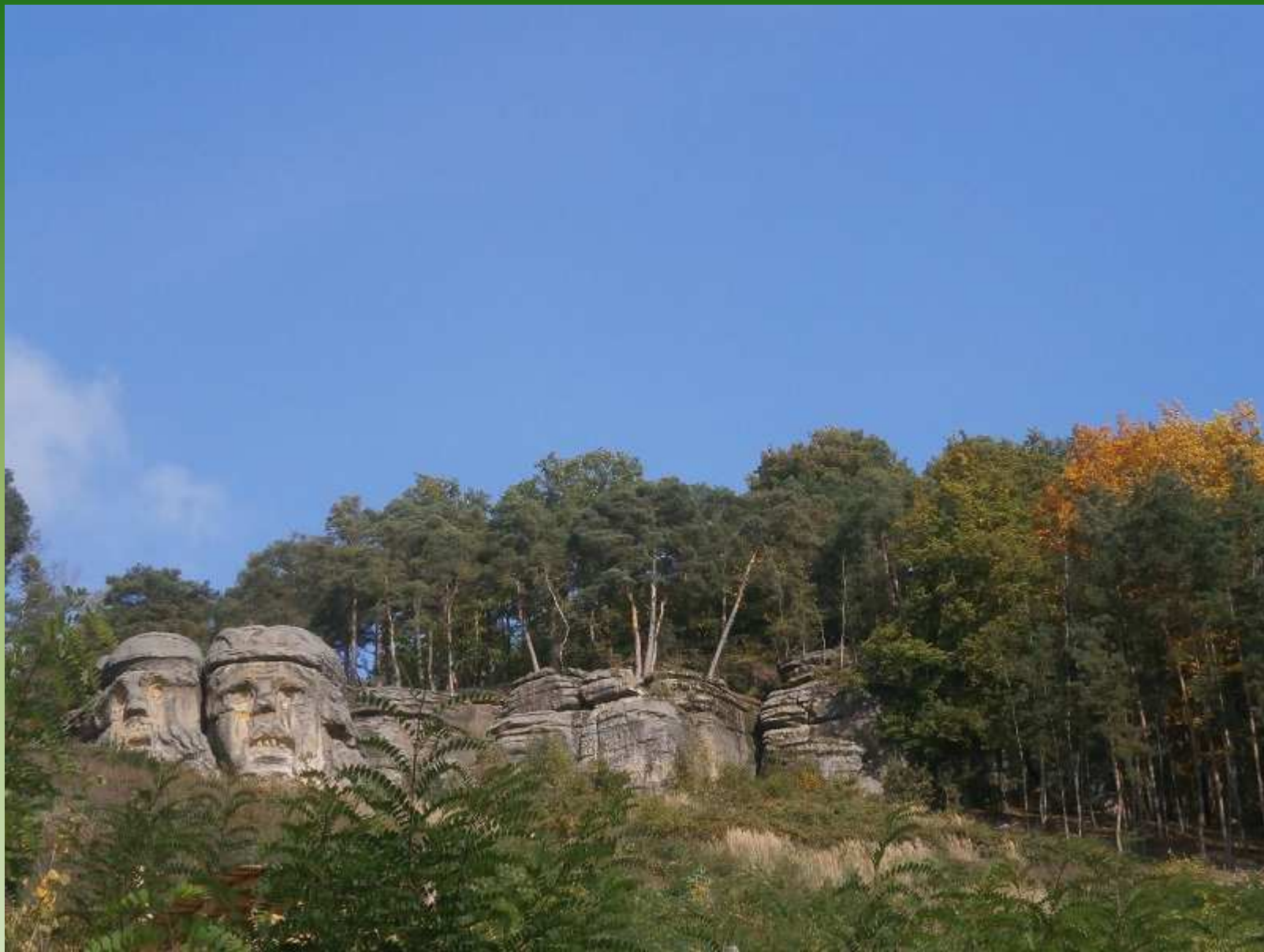
Čertovy hlavy - Želízy - Kokořínsko