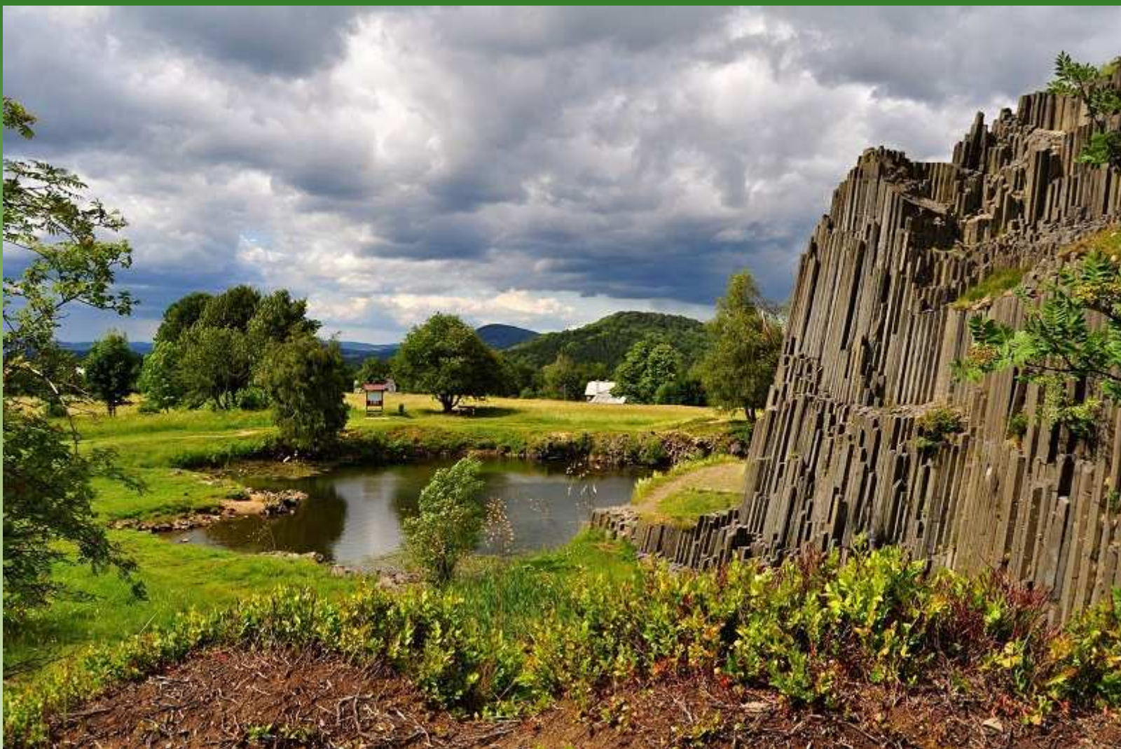
Panská skála u Kamenického Šenova, okr. Česká Lípa