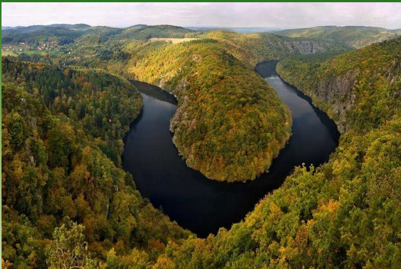
Meandr Vltavy z vyhlídky Máj nedaleko přehrady Slapy