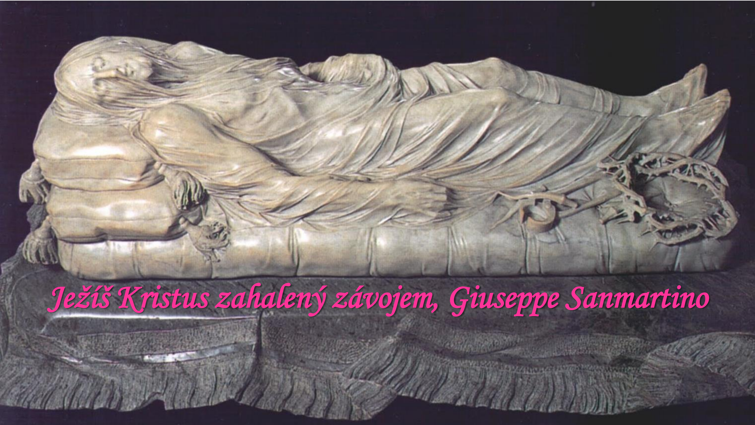
Ježíš Kristus zahalený závojem, Giuseppe Sanmartino